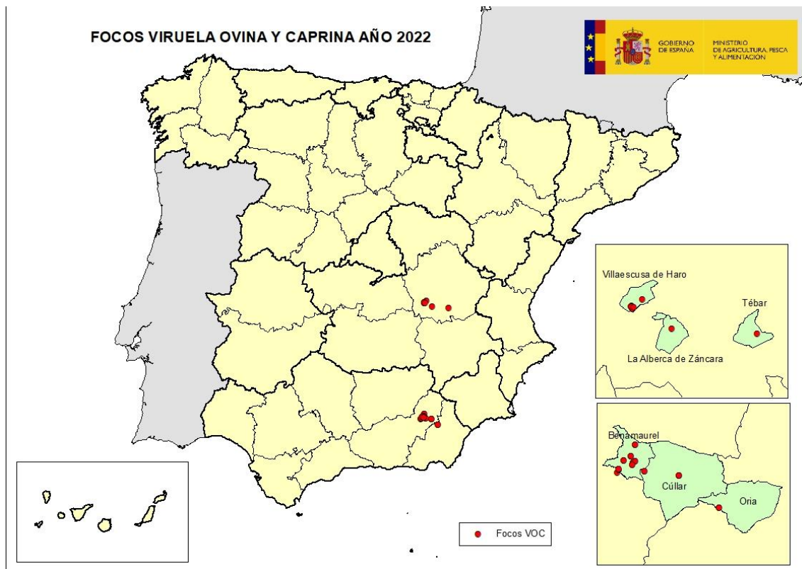
Mapa 2: Localización de las explotaciones afectadas por VOC en España

En total se han confirmado en España hasta la fecha, un total de veintitrés focos de la enfermedad: doce en la provincia de Granada, uno en la provincia de Almería, y diez en la provincia de Cuenca (ver mapa 2).