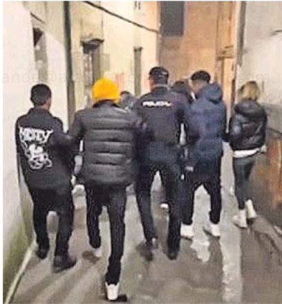
Captura de pantalla del vídeo colgado en redes sociales.

Según el relato policial, esa madrugada se produjeron tres episodios violentos, el principal tuvo lugar cerca de las 4.00 horas de la madrugada, cuando tres de los ahora detenidos se encontraron en la rúa da Catedral con