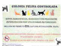
Carteles en Lugo.

El objetivo de Michos es superar las 200 esterilizaciones a finales de este año, incluyendo una pequeña partida que llevaron a cabo el pasado 2020. Las actuaciones tienen lugar gracias al Concello de Lugo, que asegura que hace un control y seguimiento de las mismas, y que en función de los trabajos otorgan la subvención. El convenio firmado entre ayuntamiento y asociación asciende a 15.000 euros y tiene como fin «acabar a diminución do número de integrantes dos grupos, á vez que se supervisan sanitariamente», dijo en su día la alcaldesa,