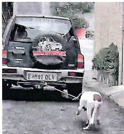
Captura del vídeo difundido a través de las redes sociales el viernes.

La Asociación Nacional Animales con Derechos y Libertad (ANADEL) confirmó en días pasados que, de haber causa judicial, se personará como acusación particular, aunque al descartar el Seprona esta opción todavía están valorando otras posibles acciones legales, como la denuncia en Fiscalía, porque en-